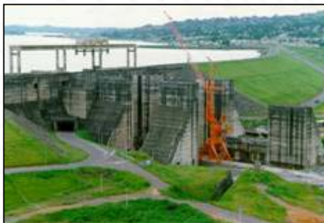
Eclusa de Tucuruí